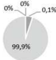
2. Investissements alignés à la taxinomie : excluant les obligations souveraines